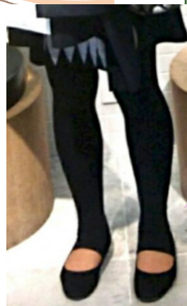
膝ケア1年4ヵ月後 2016年