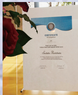
当校は口腔ケアセミナー開催の 権利の取得をしています。

口腔ケアすることで、体の炎症を減らし、 リウマチ、糖尿病、大動脈解離、認知症などの リスク回避を狙った内容で、精油の持つ利点を 余すことなく発揮させる内容です。