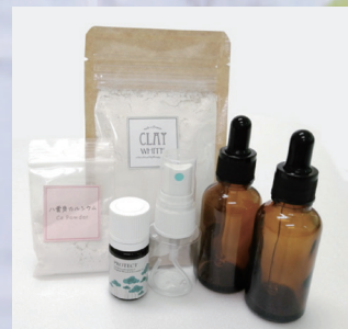
講座で使用するクラフト になります。