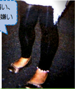
膝ケア前 2007年 39才

痛い、むくむ、冷える、太い…女性の脚の4大苦ですね。 女性の脚のお悩みはつきません。