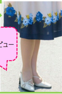
2017年膝ケア2年7か月後